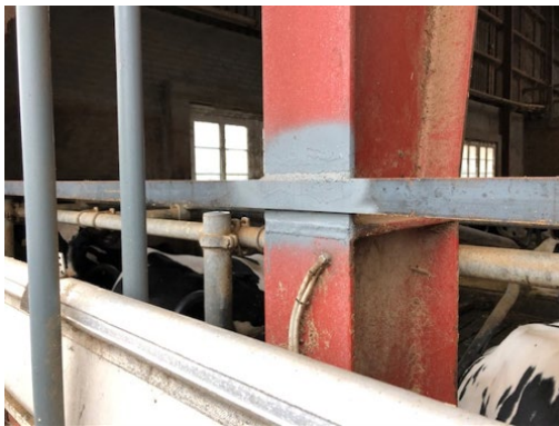
Billede 3: Potentialeudligning udført med på-svejset båndstål på stålramme/spær. Denne svejste forbindelse erstatter den tidligere, der ses som en på boltet ledning på spæret

Spændingsforskellene mærkes, når de er i kontakt med to eller flere ledende overflader, som har forskelligt elektrisk potentiale. Dette kan afhjælpes ved at sikre, at alle ledende overflader (som dyrene kan komme i kontakt med) har samme potentiale, det vil sige samme spænding, ved at binde dem sammen. Ledende overflader er fx inventardele, drikkeopper eller -ventiler, vakuumledninger, ripperør, foderrør, huler, vandrør, stålspær, forværk, malkestald, samt fugtige betongulve mm. I det følgende benævnt som inventardele.