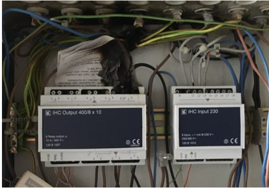
Billede 4: Eksempel på elektrisk antændt vejledning placeret i el-tavle. Dårlig forbindelse i terminal resulterer i brand