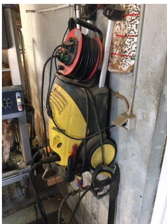
Billede 6: Forlængerledning anvendt fejlagtigt, som erstatning for en permanent løsning