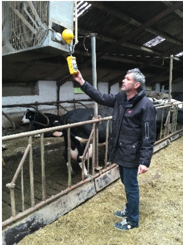
Billede 5: Fejlfinding ved hjælp af feltmåler

Har man mistanke om, at udstyr skaber problemer i stalden, kan man afbryde forbindelsen og se om det resulterer i en forbedring af dyrenes adfærd. Er det tilfældet kan udstyret være defekt og kræver eftersyn, reparation, eller udskiftning udført af en elektriker