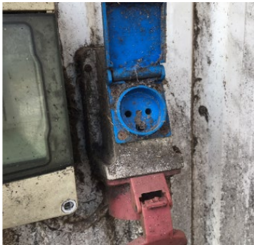
Billede 1: Det ses ofte, at CEE-stikudtag, kombineret med 230V er defekte med åbenstående eller helt manglende låg. Disse kan være årsag til afledningsproblemer og skal udskiftes

BEMÆRK: Alt vedrørende strøm, målinger og reparationer heraf, skal udføres af en autoriseret elektriker.