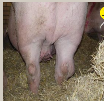
Haseledsbetændelse Bedømmelse: Betinget transportegnet