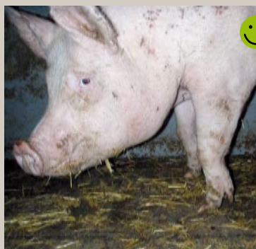
Krumme forben (styltefod) Bedømmelse: Transportegnet