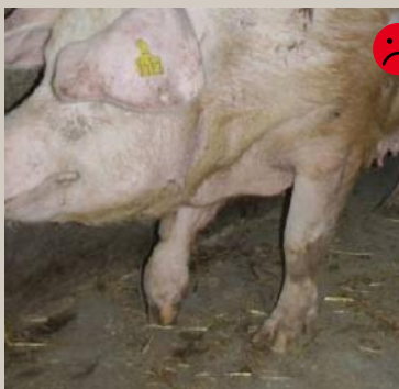
Klovbrandbyld Bedømmelse: Ikke transportegnet