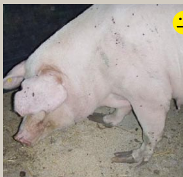
Forvoksede klove Bedømmelse: Betinget transportegnet