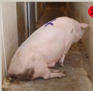
Udskridning Bedømmelse: Ikke transportegnet