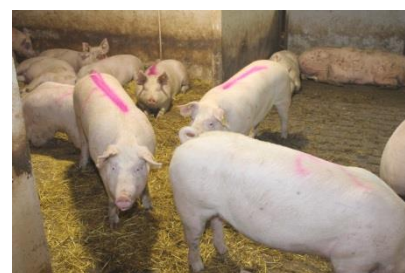
Polte i samme alder og størrelse

Forvent at 80-90 % af poltene kommer i 2. brunst 3 uger efter 1. brunst.