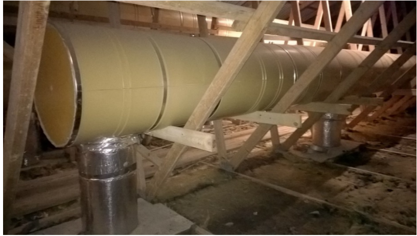
Billede 1. Punktudsugningsanlægget i staldrummet og på loftet.

PVC-rørene havde et åbningsareal på 0,07 \text{ m}^2 og med to sugepunkter pr. sektion gav det et åbningsareal på 0,14 \text{ m}^2 . Punktudsugningen blev via målevinger, som var monteret i PUR-røret på loftet, indstillet til ca. 1.000 \text{ m}^3/\text{t} pr. staldsektion via drejespjældene, hvilket svarede til en lufthastighed på 2 \text{ m/s} i punktudsugningsrørene. Spalteåbningerne i en sektion udgjorde ca. 3,6 \text{ m}^2 , som svarede til 0,038 \text{ m}^2 spalteåbning pr. stiplads. Det gav en teoretisk lufthastighed gennem spalteåbningerne på i gennemsnit 0,08 \text{ m/s} ved en punktudsugningsydelse på 1.000 \text{ m}^3/\text{t} pr. staldsektion. Spaltegulvet i gødeområdet vil samtidig aldrig være helt rent, og ved for eksempel 20 \% tilkitning af spalteåbningerne giver det en lufthastighed på i gennemsnit 0,1 \text{ m/s} ned gennem spalteåbningerne.