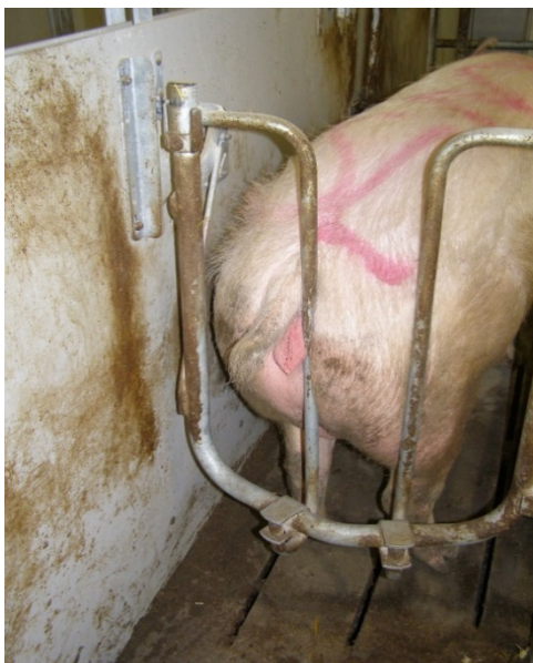
Billede 7. For at kunne åbne baglågen skal begge rør aktiveres, her aktiveres kun ét af rørene, Jyden Bur.