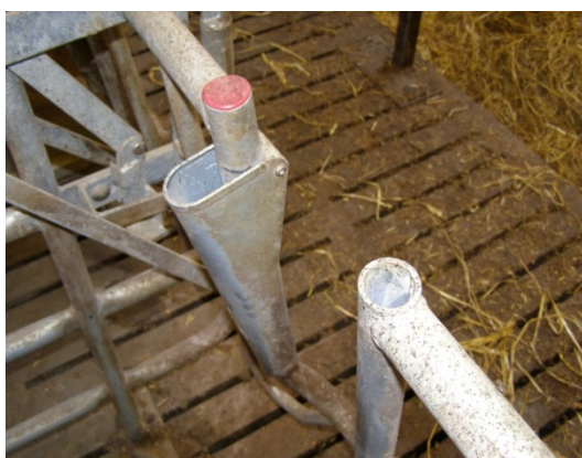
Billede 8. Baglågens åbnemekanisme, Egebjerg (ACO Funki)