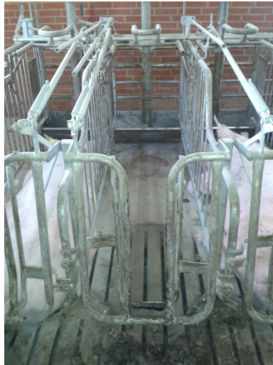
Billede 2. Boks fra Vissing Agro