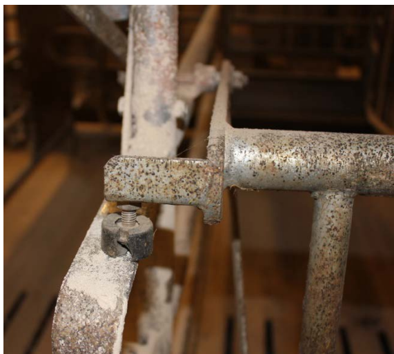
Billede 18. Flækket støddæmper, Egebjerg (ACO Funki)