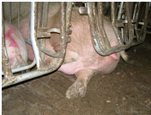
Billede 6. Baglågens åbnemekanisme, Vissing Agro