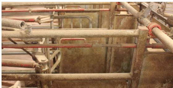
Billede 17. Enkeltbokslås, forreste håndtag, Egebjerg (ACO Funki)