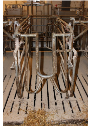
Billede 3. Boks fra Egebjerg (ACO Funki)