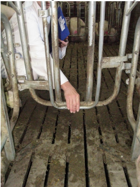
Billede 5. Baglågens åbnemekanisme, Vissing Agro