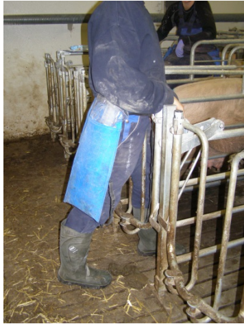
Billede 12. Besværet indgang