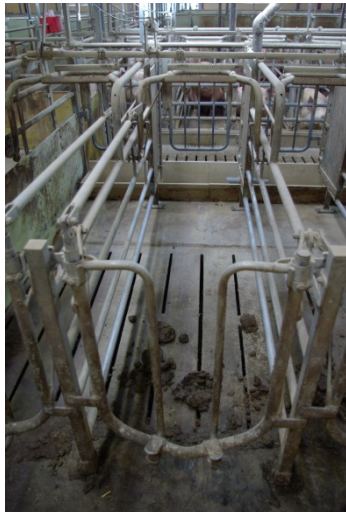
Billede 1. Boks fra Jyden Bur