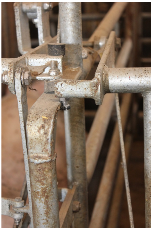
Billede 19. Baglåde uden støddæmper er faldet ned, Egebjerg (ACO Funki)