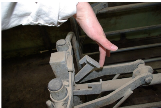
Billede 15. Enkeltbokslås, Jyden Bur