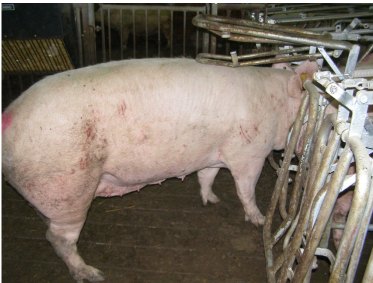
Billede 4. Nedhængende åbningsmekanisme, Vissing Agro