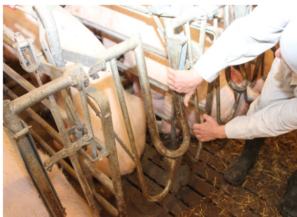
Billede 9. Baglågens åbnemekanisme, Egebjerg (ACO Funki)