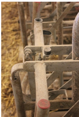
Billede 20. Manglende plastikelement, Egebjerg ACO Funki)