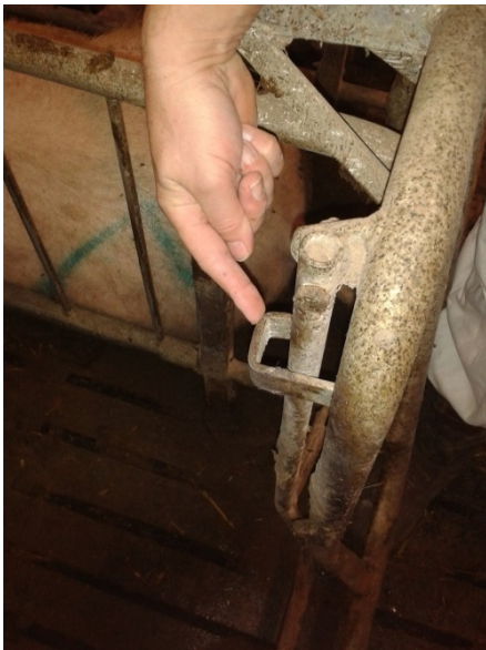
Billede 13. Inventardel hvor kateter kan blive fanget, Vissing Agro.