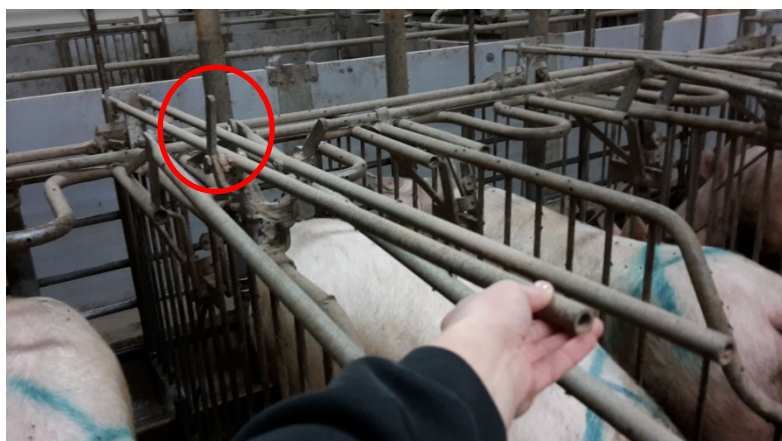
Billede 16. Enkeltbokslås, Vissing Agro