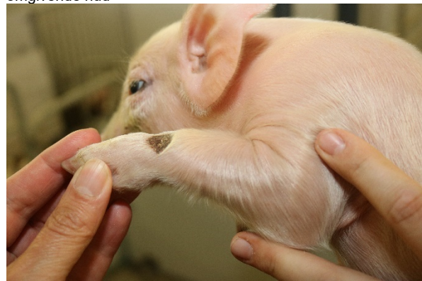
Grad 3 = Dybe sår

Hvis en pattegris døde, blev aflivet og/eller behandlet medicinsk, blev dato, ID og hændelse registreret.