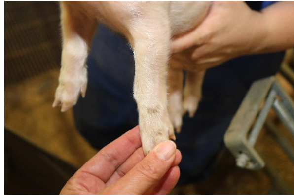
Grad 1 = Mørkfarvning under hårlaget eller lette hudafskrabninger hvor skaderne ikke var dybere end den omgivende hud