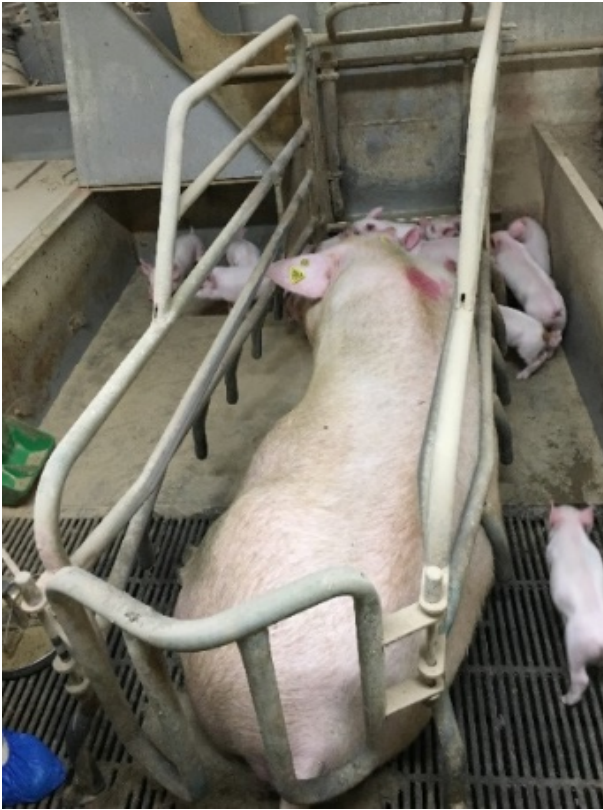
Figur 1. Indretning af faresti i afprøvningsbesætningen

Afprøvningen var et kohortestudie bestående af 1.624 grise fra 122 kuld fra i alt tre ugehold. Der blev foretaget tre vurdering af sår på forknæene dag 3-5, dag 10-12 og dag 17-19 efter faring.