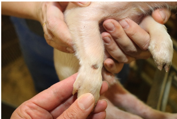
Grad 2 = Overfladiske sår