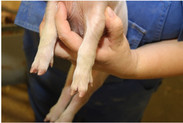
Grad 0 = Ingen synlige forandringer på forknæ