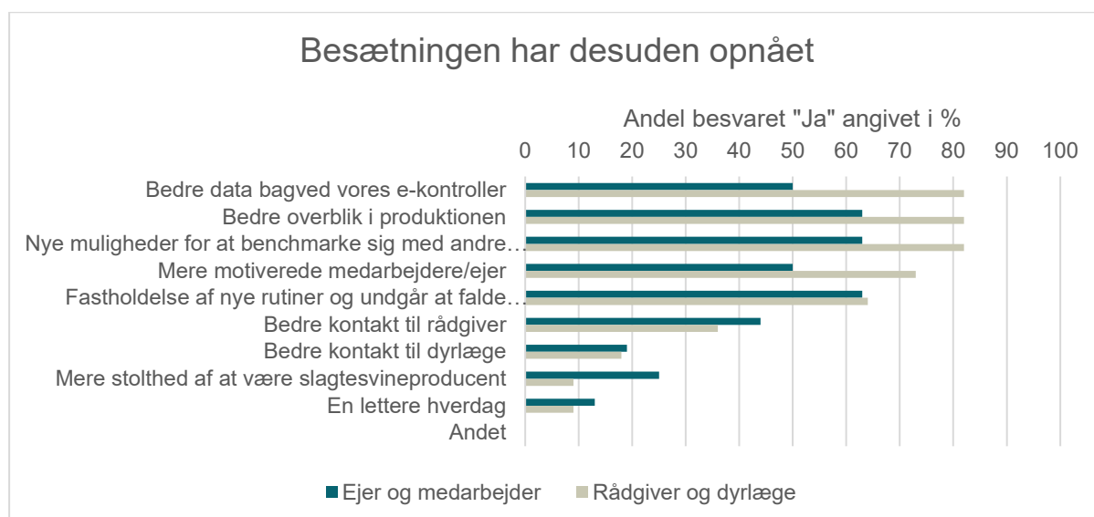
Figur 4. Svar på spørgeskema. Svar på, hvad besætningerne desuden har opnået. Gruppen af rådgivere og dyrlæger, 11 personer, er adskilt fra besætningerne med deres besvarelser.

Udover en positiv indflydelse, blev der opnået en række andre effekter. Se figur 4. Figuren er opdelt i to grupper, og der ses en forskel ved, at "Rådgivere og dyrlæger" har markeret at opleve en større effekt på data, overblik, benchmark og motiverede medarbejdere/ejer. Det er også værd at bemærke, at besætningsejer og medarbejdere, 25 procent, var blevet mere stolte af at være slagtesvineproducenter.