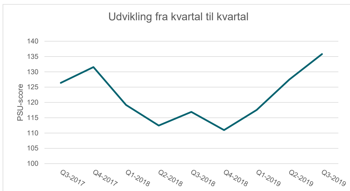
Figur 1. Udvikling i PSU-score fra kvartal til kvartal. Oplyst kvartal (Q) er det kvartal, hvor smågrisene er indsat.

Udvikling i besætningernes niveau siden start er vist i figur 1. I 2. til 4. kvartal 2018 var der et lavt gennemsnit. Det skyldtes især tre besætninger, hvis første kvartaler var med en PSU-score under 100 – altså at der var en negativ udvikling. Ud af de tre besætninger var de to ramt af sygdomsudbrud, PRRS og Ap2, under opstarten. De tre besætninger afsluttede alle deres sidste kvartal i 2019 med en gennemsnitlig PSU-score på 125 og formåede dermed alligevel at opnå en positiv effekt. En besætning var nystartet og fik derfor lov til at fastsætte før-tal ud fra andre af ejerens produktionsejendomme og erfaringer fra disse. Tal fra efter perioden stammer fra E-kontroller på aktuelle hold produceret i besætningerne og er indberettet af besætningerne og/eller deres rådgiver.