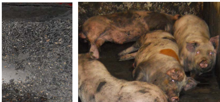
Foder tilsat 5 pct. aktivt kul bliver sort og det gør grisene også.

Alle grise er fodret med samme enhedsblanding til slagtesvin fra 30 kg til slagtning. Grisene i forsøgsgruppen fik 14 dage før slagtning samme foderblanding tilsat 5 pct. aktivt kul. Tilsætning af aktivt kul medførte sortfarvning af både foder og grise (se billeder).