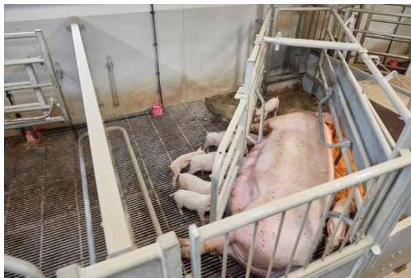
Figur 2: Placering af kop i kassesti og kombisti

Grisene i forsøgsgruppen havde mælk til rådighed i koppen fra kuldudjævning (dag et) og frem til fravænning. Mælkekopanlægget kørte tomt umiddelbart inden rengøring og opblanding af ny mælkeerstatning om morgenen. I diegivningsperioden blev der brugt to typer af mælkeerstatninger. En startblanding af mærket Pigipro 1 START (Schils, P.O. Box 435, 6130 AK Sittard, The Netherlands) og en smooth-blanding af mærket DanMilk B2B Complete (Agro Korn A/S, Skjernvej 42, DK-6920 Videbæk). Se indlægssedler i appendiks. Smooth-blanding benyttes som betegnelse for et mælkepulver, der benyttes til de ældste grise. Grisene gik fra startblanding til smooth ca. dag ti efter færing. Der blev skiftet blanding på sektionsniveau, og derfor vil grisene have varierende alder ved skift.