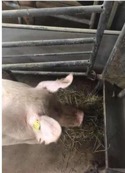
Billede 3: Tildeling af wrapphø foran soen