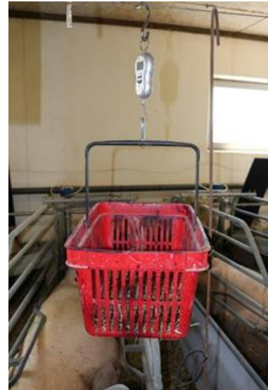
Billede 4: Kontrol af vægten på wrapphø