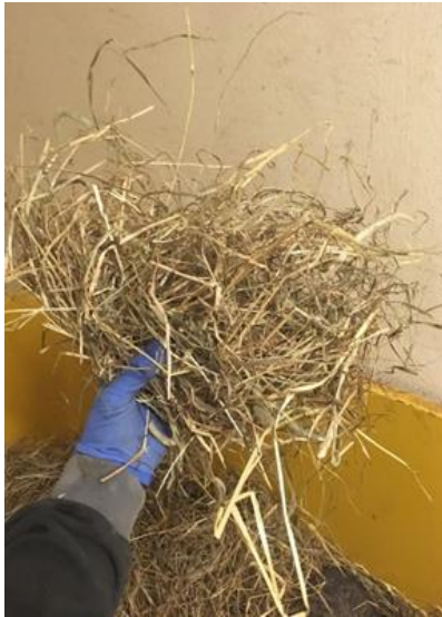
Billede 2: Cirka 100 gram wrapphø

Søerne i forsøgsgruppen fik tildelt cirka 100 gram wrapphø pr. dag fra indsættelse i farestalden indtil faringen var overstået og derefter blev mængden løbende hævet fra 100 til 150 gram wrapphø pr. so pr. dag indtil fravæning/slagtning. Det blev også prøvet at tildele en større mængde, men det resulterede i svineri i stien. Udgangspunktet var derfor, at søerne skulle kunne nå at æde den tildelte wrapphø, og at der ikke lå noget tilbage i stien. Wrapphø blev tildelt dagligt på gulvet foran soen (billede 2 og 3).