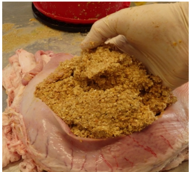
Billede 1 og 2: Maveindhold karakteriseret som vandigt (tv) og fast (th)