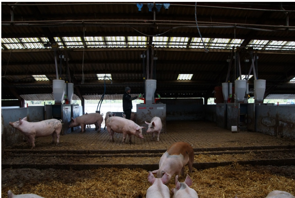
Figur 2. En af de to storstier, der indgik i afprøvningen. Åbningen ud mod udearealet ses i baggrunden. Under hver af de små fodersiloer er der placeret en foderstation, der tillod at registrere foderoptagelsen på enkeltdyrsniveau.