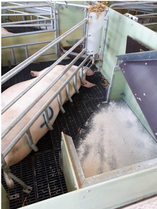
Figur 2. Eksempel på indretning af hulerne i kontrolgruppen