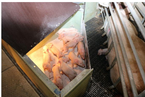
Figur 5. I kontrolgruppen blev der gennemført huletræning i forbindelse med fodring af soen.

Af tabel 1 ses, at andelen af grise, der benyttede hulen, var statistisk sikkert højere ( p=0,027 ) i forsøgsgruppen, hvor der blev anvendt halm, sok og jutesæk (figur 6), sammenlignet med kontrolgruppen, hvor der blev foretaget huletræning (figur 5). Således benyttede cirka 32 % af grisene hulen i kontrolgruppen mod cirka 37 % i forsøgsgruppen. Til sammenligning viste en anden undersøgelse, at 35 % af grisene benyttede hulen dag 2 efter faring [11]. Det viser, at det er vanskeligt at få en stor andel af pattgrisene ind i hulen de første dage efter faring.