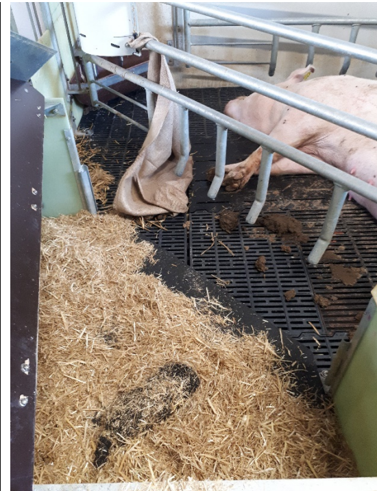
Figur 3. Eksempel på indretning af hulerne i forsøgsgruppen. Inden indsættelse af soen var der tildelt halm i hulen samt lagt en sok med hvedekerner. Jutesækken blev lagt i hulen, når faringen begyndte.