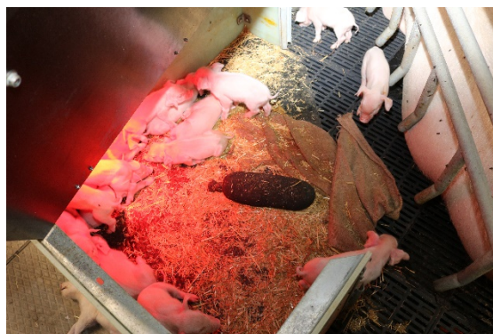
Figur 6. I forsøgsgruppen var hulen indrettet med halm, sok med hvedekerner samt en jutesæk, som soen havde benyttet som redebygningsmateriale.