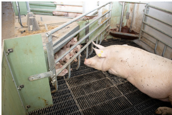
Figur 1a. Faresti der indgik i afprøvningen, var indrettet med fulddrænet gulv og en hule

Staldtemperatur og varmetilførsel til hulen blev inden afprøvningen begyndte indstillet jf. de gældende anbefalinger fra SEGES Svineproduktion. For at sikre, at temperaturen var optimal i pattegrisehulerne, indgik stier ved ydervæggene ikke i afprøvningen. Varmelampen i hulen blev tændt i god tid før forventet faring.