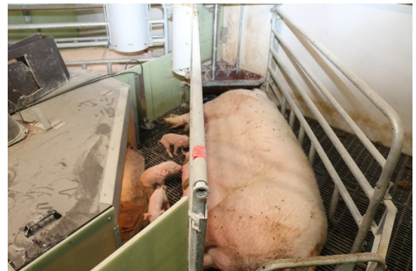
Figur 1b. I forbindelse med faring var soen opstaldet i boks. Søerne fik tildelt halm som redebygningsmateriale i en hæk, der var opsat på den ene boksside (øverst på billedet).

Søerne var løsgående fra indsættelse og indtil lige før faring/dagen før forventet faring. Boksen blev åbnet dagen efter kastration – svarende til dag 3-4 efter faring.