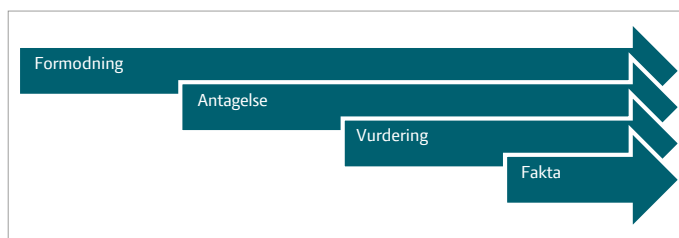
Figur 3. Kvalitativ vurdering af økonomi i HR.

Den økonomiske effekt af udgiften til HR-arbejdet vil kunne måles på lønsummen (mindre udskiftning af medarbejdere og færre sygedage) og på produktiviteten. Som ved alle andre økonomiberegninger er resultatet afhængig af de valgte forudsætninger og beregningsmetoder. Men regnestykket er ikke anderledes, når det handler om HR-indsatsen, end hvis det var investering i et "stykke teknik".