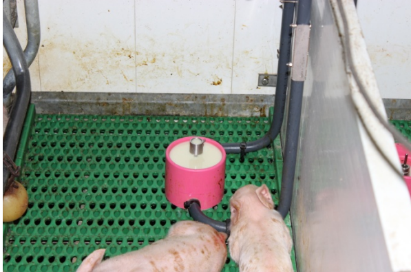
Foto 16. Koppen, som fyldes med mælk fra RescueMilk-systemet.