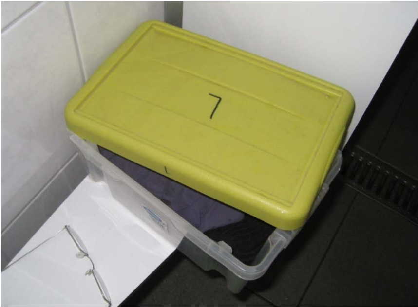
Foto 20. Kasse med færdigpakket skiftetøj mærket med størrelse hos Familien Smeenk.

Internt havde de fodtøj/redskaber og så videre farvekodet til hvert område i besætningen. Afgrænsningen mellem fare- klima- og drægtighedsstalde var i form af en kraftig lægte, der var hængt tværs over gangen (se foto 21). Ved denne skiftede man tøj og støvler og der var håndvask/desinfektion. Men der var ingen rist at stå på eller afløb i gulvet, så omklædningsområdet var ikke helt rent, når man passerede fra det ene område til det andet. Dermed blev der alligevel flyttet noget, om end kun ganske lidt gødning mellem aldersgrupperne.