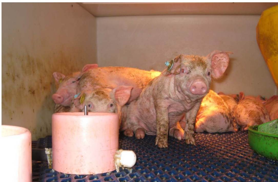
Foto 23. Pattegrise i rescue-deck. Grisene tilsmudsede af foder og mælk, derfor fryser de.

Der anvendes også en speciel mælkeblending fra Provimi til grise i farestalden. Dette udfodres i små trug fra dag 4 -10. Grisene får en lille portion, når de trykker på niplen i truget, der dermed hele tiden kan holdes rent. Fra dag 11 får de opblødt foder. De kan dermed få grisene op på 1.000 g optaget tørstof før fravæning, sammenlignet med ca. 400 g når der kun gives tørfoder. Det er vigtigt også at få dem tilvænnet piller, hvis de skal på tørfoder efter fravæning.