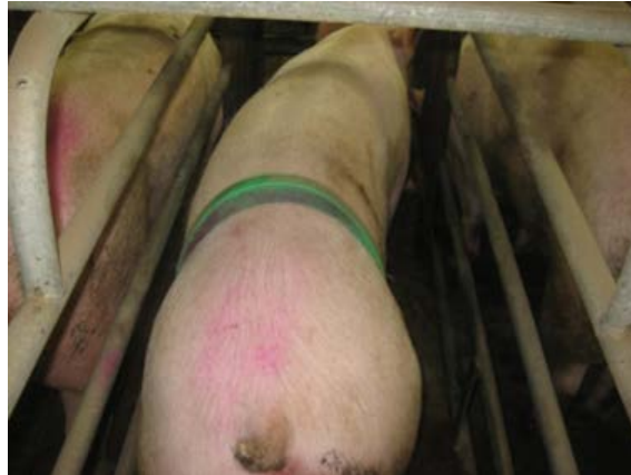
Foto 5. Insemineringsbøjle på so til stimulering.

I den ene besætning bestilte de sæd om lørdagen, for at have sæd til mandag morgen. Der leveres ikke sæd om søndagen, og sæd bestilt mandag leveres først over middag, hvilket ikke passede ind i svineproducentens praktiske program. Der kontrolleres normalt for brunst søndag eftermiddag samt mandag morgen, og der insemineres typisk 1. gang mandag eftermiddag. Tirsdag insemineres de søer, der vil stå. Der insemineres typisk maks. 2 gange pr. so. Farringsprocenten ligger normalt på omkring 90 %.