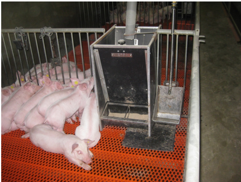
Foto 18. Smågrise, der klumper sig sammen for at holde varmen.

Vi besøgte smågrisestalde med små stier indrettet med fuldspalter og ingen overdækning. Der var en højere staldtemperatur end i Danmark, men der var også et indtryk af, at der i dette system kan være en udfordring i at opnå en høj nok temperatur ved indsættelse i disse stier (se foto 18). Der var meget grundig rengøring forud for indsættelse af grisene. Beskæftigelsesmaterialet bestod af en kæde med en gummiklods i enden, og denne hang ca. 15 cm over gulvhøjde. Smågrisene havde isat øremærker, hvilket er et krav i forbindelse med levering til slagteri.