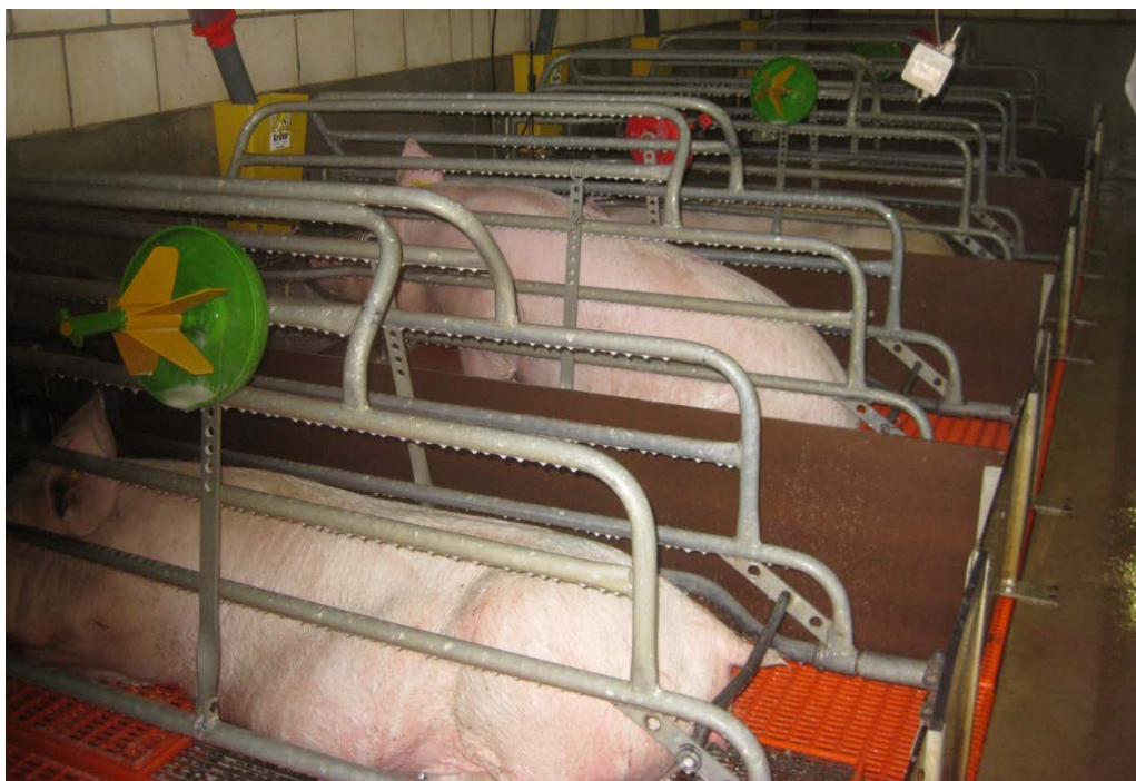
Foto 22. Rene søer i rene stier.

Også i denne besætning blev søerne vasket inden faring. De blev vasket i farestien på fuldspaltegulvet med koldt vand med PIP tilsat. De så ud til at kunne lide det.