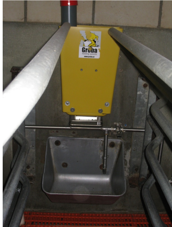
Foto 15. Nærbillede af krybbe og foderautomat.

I den ene besætning var der monteret en ringeklokke ved håndtaget til udfodring. Ringeklokken blev brugt inden udfodring således, at søerne vidste, hvornår det var fodertid. Søerne reagerede derfor ikke på, at personalet gik ud og ind af sektionerne i løbet af dagen, men kun når klokken lød.