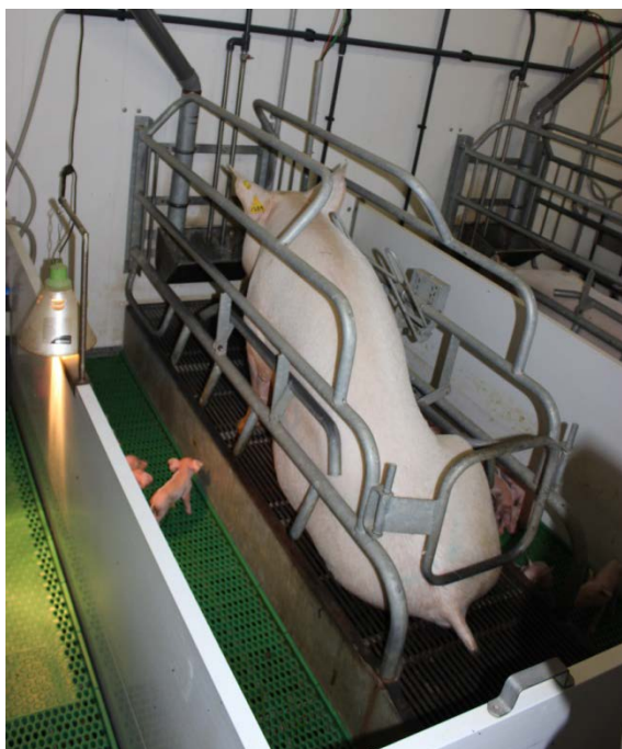
Foto 11. Soen har ved at sætte sig op aktiveret kontakten (bøjlen over soens ryg) til at få gulvet sænket. De få dage gamle grise er havnet på begge sider af soen og kun dem på venstre side har glæde af varmelampen, indtil soen igen lægger sig ned.

Farebøjlerne var med ingen eller kun ganske lille justeringsmulighed. I to af besætningerne var det på grund af gulvets udformning tilmed umuligt at benytte andre bøjler, idet soens og pattegrisenes gulv ikke var i samme niveau; i den ene besætning var soens gulv hævet et par cm over pattegrisenes. Formålet hermed var at give pattegrisene lettere adgang til soens nederste pattesæt. I den anden besætning var der hæve-/sænkegulv til pattegrisene, det vil sige at når soen rejste eller satte sig op, blev grisene sænket ned (se foto 11). Formålet hermed var at sikre, at pattegrisene ikke kunne lægge sig under soen eller blive trådt på, mens soen stod op. Foto 11, viser en tydelig ulempe ved denne løsning nemlig, at de kun få dage gamle grise her er havnet på den side af soen, hvor der ingen varmekilde er. Varmelampen sænkes i øvrigt ikke med gulvet, så uanset hvilken side pattegrisene er på, når gulvet sænkes, bliver der koldere i deres nærmiljø.