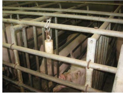
Foto 8. Et typisk eksempel på legetøj (rode-/beskæftigelsesmateriale) til søerne.