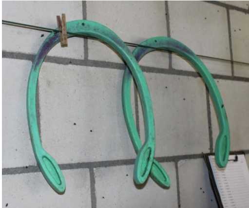
Foto 4. Insemineringsbøjler til stimulering af søerne.