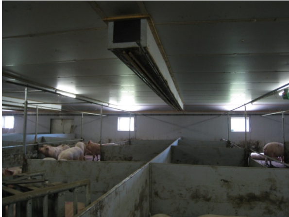
Foto 9. Fordeling af indtagsluften via fordelingskanal placeret hen over søernes lejeareal.