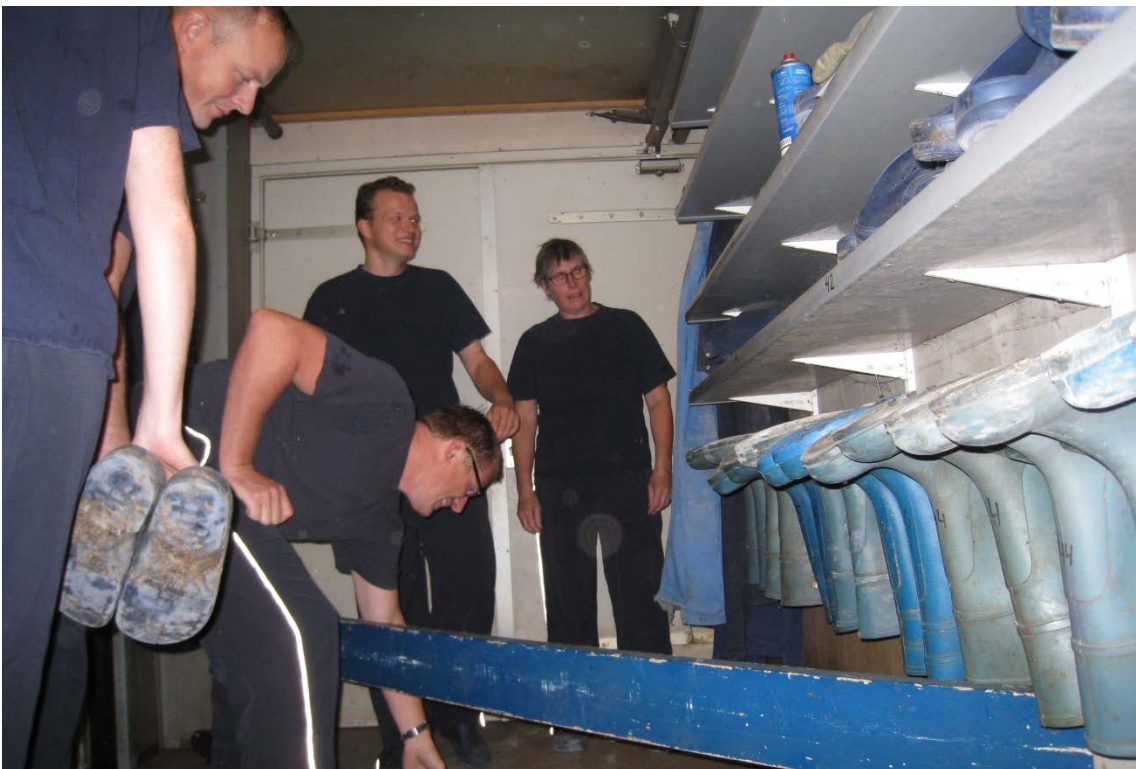
Foto 21. Overgang mellem to staldafsnit.

Internt havde de fodtøj/redskaber og så videre farvekodet til hvert område i besætningen. Afgrænsningen mellem fare- klima- og drægtighedsstalde var i form af en kraftig lægte, der var hængt tværs over gangen (se foto 21). Ved denne skiftede man tøj og støvler og der var håndvask/desinfektion. Men der var ingen rist at stå på eller afløb i gulvet, så omklædningsområdet var ikke helt rent, når man passerede fra det ene område til det andet. Dermed blev der alligevel flyttet noget, om end kun ganske lidt gødning mellem aldersgrupperne.