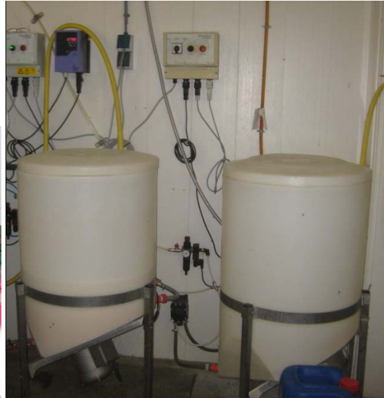
Foto 17. Blandetanke til RescueMilk.