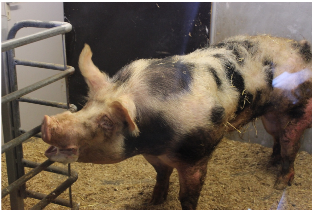
Foto 3. Pietrain-orne bliver fremvist i "showroom". Vi står bag en rude og ser ornerne præsenteret én af gangen.

Klasse KI har en produktion af 10.000 søer på friland i England, hvorfor de har udviklet en speciel solinje (solinjen indeholder Duroc). Duroc-orner bruges til produktion af smågrise/slagtesvin til det tyske marked, mens Duroc-orner anvendes i solinjer til de engelske udendørs søer. Firmaet tror på, at Duroc vil vinde markedsandele, da den har en lav kødprocent, og en hurtig tilvækst og det til trods for, at den ikke er så kødfuld som Pietrain. Stationens Pietrain-orner er halotangen-frie. De har dog en enkelt belgisk ornelinje, der er bærer af genet, men de arbejder på at få avlet genet ud. Der er ca. 20 % DanAvl søer i Holland, mens resten er Topigs-søer. I Holland opnår svineproducenten den bedste afregning ved at anvende en Pietrain-orne på en Topigs-so, til trods for den langsommere tilvækst. I modsætning til Danmark må sædportionerne i Holland kun indeholde sæd fra en enkelt orne.