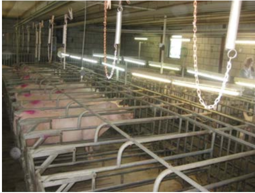
Foto 7. Løbestaldsbokse i den ene besætning. Billedet viser lysstofrørens placering over søerne i løbeafdelingen. Kæde og fjeder, som ses på billedet, er til at holde sædportionen således at man ikke behøver at være ved soen mens hun insemineres.