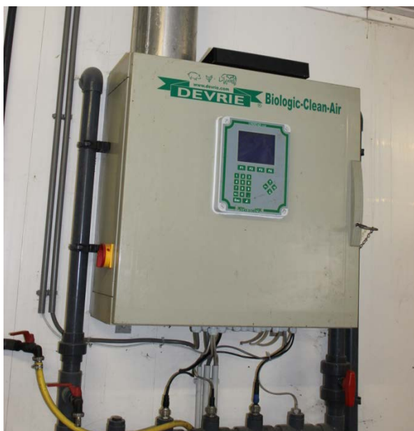
Foto 19. Styringskab til biologisk luftrensner.

Som nævnt indledningsvist, besøgte vi tre forskellige staldanlæg på turen. Generelt kører de med et lavere ventilationsforbrug pr. dyr, hvilket som udgangspunkt vil gøre det billigere at rense luften fra stalden. Det er dog ikke den primære årsag til det lavere ventilationsforbrug, men derimod er årsagen formentlig, hvorledes luftindtaget er udformet i staldene. I farestalden var frisklufttildeling direkte i krybben ved søerne og i drægtighedsstalden blev den friske luft ført via kanaler i loftet direkte ned i dyrenes lejeareal. Det lave luftskifte var medvirkende til, at det ikke lugtede så meget af gris udenfor staldene. I staldene med gulvudsugning var luftkvaliteten god. Udsugningsluften blev ledt ud via udsugningsenheder placeret i loftet, hvor luften herefter blev samlet i en central kanal, hvorpå der var tilkoblet en luftrensner. I de tre besætninger, som vi besøgte, blev staldluften ledt igennem en biologisk luftrensner (100 % rensning af al staldluft). De blev dog ikke observeret i drift.