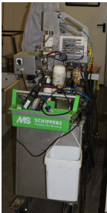
Foto 6. Veludstyret kastrationsvogn.

Holland forventes i 2018 helt at stoppe kastrationen, og de hollandske slagterier modtager i dag hangrise.