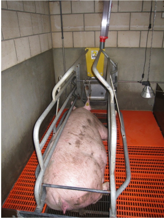
Foto 14. Her ses foderkassen, som bestemmer mængden af foder, der ryger ned i automaten. Soen skal selv aktivere foderautomaten for at få foderet ned i krybben.