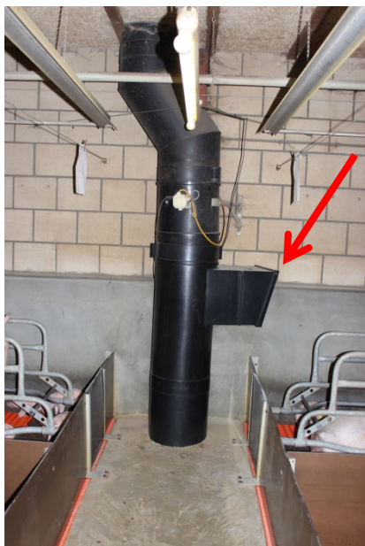
Foto 12. Billedet viser røret til gulvudsugning. På siden af røret ses en tragt, som trækker luft fra staldrummet, når ventilationsbehovet overstiger gulvudsugningens ydelse på 35%.

ventilationsbehovet oversteg de 35 %, blev der suget luft fra staldrummet ud gennem siden (se rød pil på foto 12). I den tredje besætning var der undertryksventilation med diffust luftindtag og loftudsugninger.