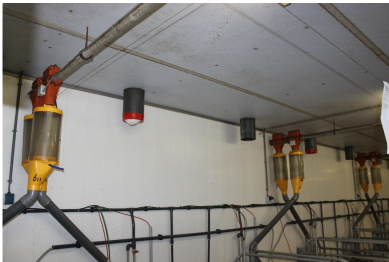
Foto 13. Indtagsluften ledes direkte ned i soens nærmiljø.