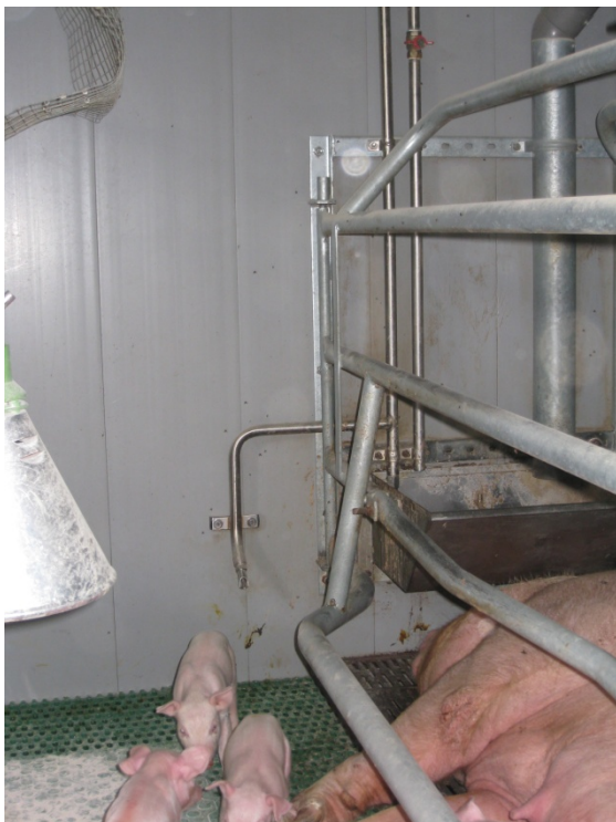
Foto 10. Billedet viser pattegrisenes drikkenippel, som sidder på samme vandør som soens og i øvrigt tæt på, hvilket reducerer mængden af "dødt" drikkevand til pattegrisene, når de begynder at drikke. På billedet ses i øvrigt to vandør ned til soens krybbe. Det ene rør har en hane på således, at man manuelt kan forvande soen.

I alle tre besøgte besætninger var farestaldene indrettet med kassestier med fuldspalter, dog med undtagelse af et lille område med fast gulv (varmeplade) til pattegrisene. I soens område var der støbejernspaltegulv, mens der i den resterende del af stierne var plastspaltegulv. Fuldspaltegulvet gav mulighed for, at pattegrisenes drikkenippel kunne placeres ved siden af soens krybbe (se foto 10); drikkenippen sidder tæt på soens, og på et kort vandør med udspring fra soens vandør. Placeringen reducerer risikoen for at vandet til pattegrisene bliver "dødt" og bakteriefyldt, inden de rigtig begynder at bruge drikkenippen og dermed selv sørger for et vist vandflow.