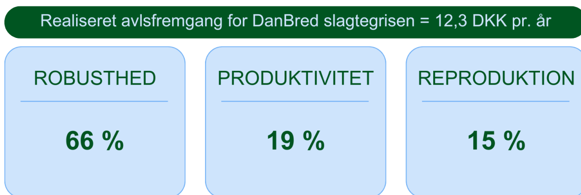
Figur 1. Den realiserede avlsfremgang for de seneste to år har været 12,3 DKK pr. år pr. DanBred slagtegris, men formodes at være endnu højere, da egenskaben so-overlevelse ikke har kunnet medregnes i opgørelsen. Den forventede avlsfremgang er inddelt i tre kategorier: robusthed (pattegriseoverlevelse og styrke), produktivitet (patte- og smågrisetilvækst, slagtegrisetilvækst, kødprocent og slagtesvind) og reproduktion (kuldstørrelse).

egenskab, der forbedres igennem soen. Resultaterne viser tydeligt, at DanBred Duroc er forklaringen på den store forbedring i pattegriseoverlevelsen, der er sket på blot to år. Samlet set har robusthedsegenskaberne bidraget med 66 % af den samlede avlsfremgang, egenskaberne for produktivitet har bidraget med 19 %, og reproduktion har bidraget med 15 % (Figur 1). De seneste to år har den samlede avlsfremgang været 12,3 DKK pr. år pr. DanBred slagtegris. Men den reelle samlede avlsfremgang formodes at være endnu højere, da egenskaben so-overlevelse ikke har kunnet medregnes i opgørelsen, fordi resultaterne endnu ikke kan beregnes troværdigt.