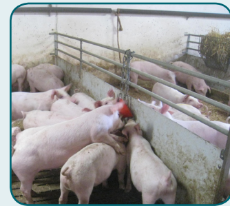
Flere grise kan få adgang, hvis materialet hænger midt i stien (f.eks. reb og Bite-Rite).