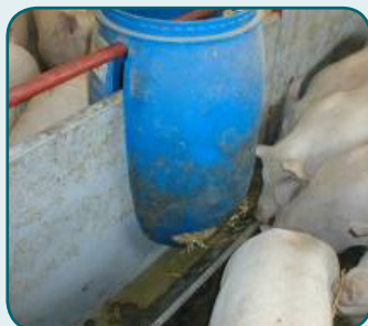
Tønden hænger så langt nede, at den optager en ædeplads.

Eksempler, hvor der i bedste mening er tildelt R&B, men hvor der er nogle uforudsete ulemper, som gør materialet mindre interessant, svært at få fat i eller på anden vis bør gentænkes: