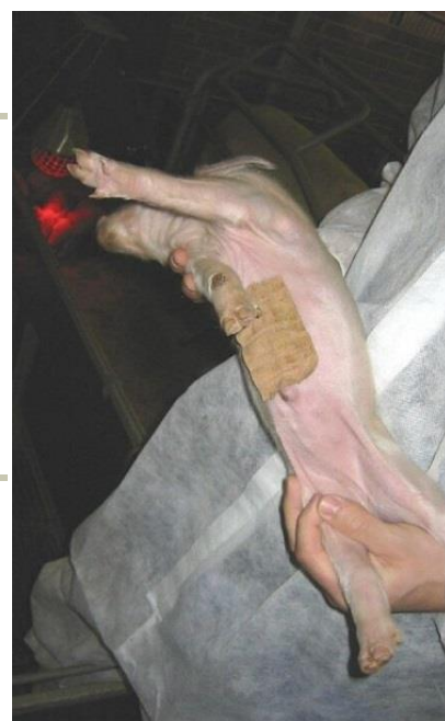
Forreste patter dækkes med plaster for at undgå skader