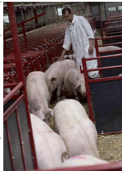
Rolig omgang med dyrene giver rolige polte, der er vant til menneskelig kontakt