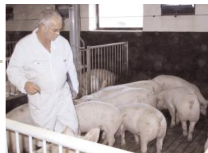
Når polten vurderes skal der være plads til at den kan bevæge sig frit