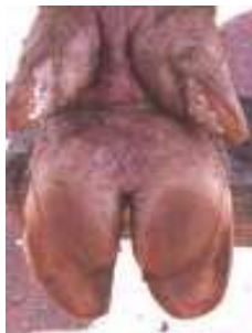
Den sunde klov