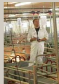
Смотреть комментарий на карточку свиноматки.