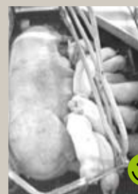
Har soen store ensartede grise? Tag højde for om soen har været ammesø.