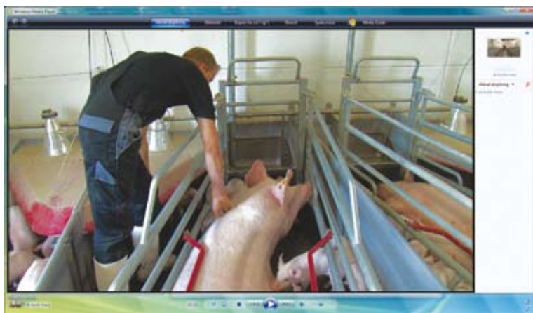
Se videoen af samme navn på www.dansksvineproduktion.dk/video