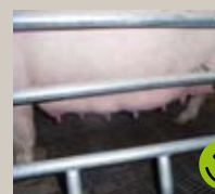
Tæl antallet af velfungerende patter på soen.