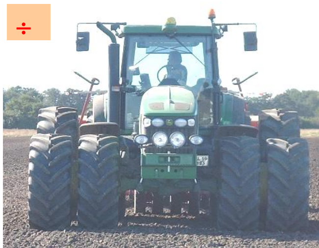
Manglende arbejdsplaner kan medføre misforståelser

Manglende aftaler for farestaldsarbejdet kan medføre: