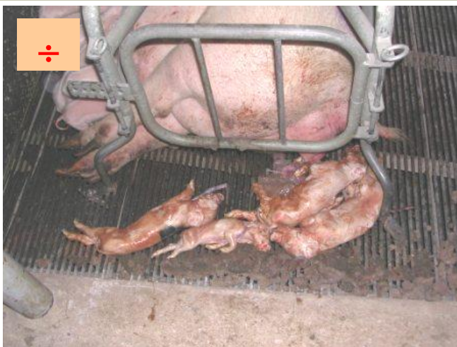
Et dårligt faringsforløb, der ikke er blevet overvåget