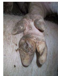
Uens klove og balleforhorning