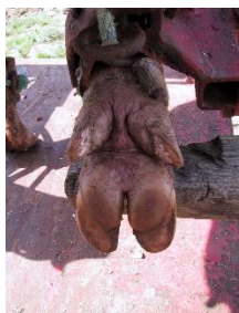
Den sunde klov med ensartede klove og ingen balleforhorning