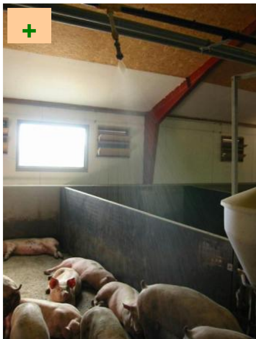
Korrekt placeret overbrusning med fladdyser