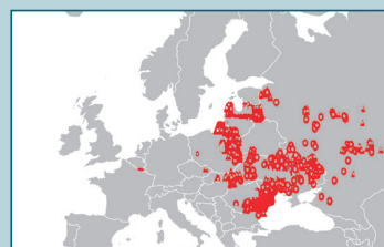
Komisja Europejska i OIE. ASF wśród dzików i świń domowych 2019.

Zwierzęta mogą zostać zainfekowane poprzez karmienie surowymi odpadami z rzeźni, surowym mięsem czy surowymi odpadami mięsa, które były zakażone wirusem, lub też w czasie transportu zwierząt. Od chwili zainfekowania zwierzęcia do czasu wystąpienia objawów choroby upływa zazwyczaj 5-10 dni. Objawy chorobowe są prawie takie same, jak w przypadku klasycznego pomoru świń: wysoka śmiertelność, wysoka gorączka, ostra biegunka i czerwone lub sinawe wybroczyny na skórze.