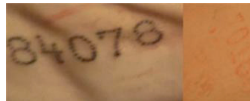
FIG 1 Eksempel på en god og en dårlig tatovering

Tatovering af både højre og venstre skinke