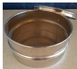
Skiold-håndsigte med 1 mm sold. Sigtetid 2 minutter. Velegnet til alle dyregrupper.