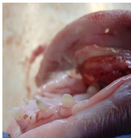
3. Korrekt slebet tænder