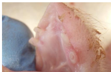
4. Tænder som er slebet for dybt