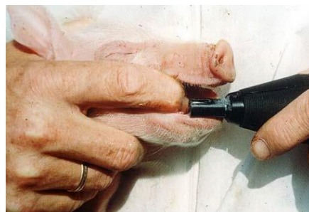
1. Sådan holdes grisen

Pattegrises hjørnetænder kan slibes indenfor dyrets 4 første levedøgn, hvis der er dokumentation for, at der på bedriften er sket skader på søers patter eller på andre svins hoveder, herunder ører, som følge af at slibning ikke er foretaget. Slibning af hjørnetænder må kun foretages af en person som er uddannet heri, og som har erfaring (BEK nr. 17, 2016).