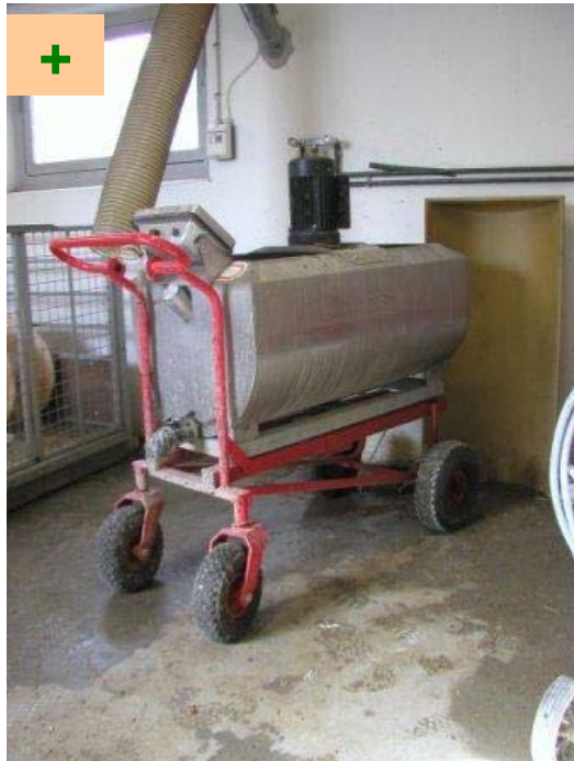
Fodervogn til udfodring af opblødt foder. Fravænningsblandingen udfodres som tørfoder eller vådfoder / opblødt foder

Ad libitum fodring sikrer, at grisen får det foder, som passer til dens appetit: