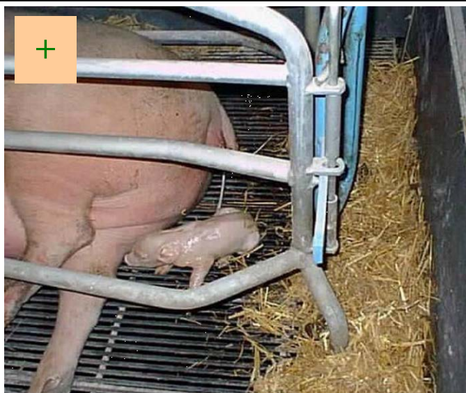
Nyfødt pattegris, der er observeret rettidigt