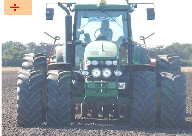
Manglende arbejdsplaner kan medføre misforståelser