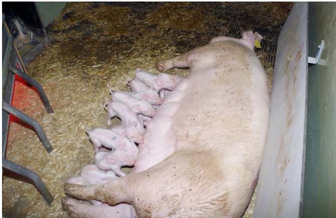
Farestier til løse søer