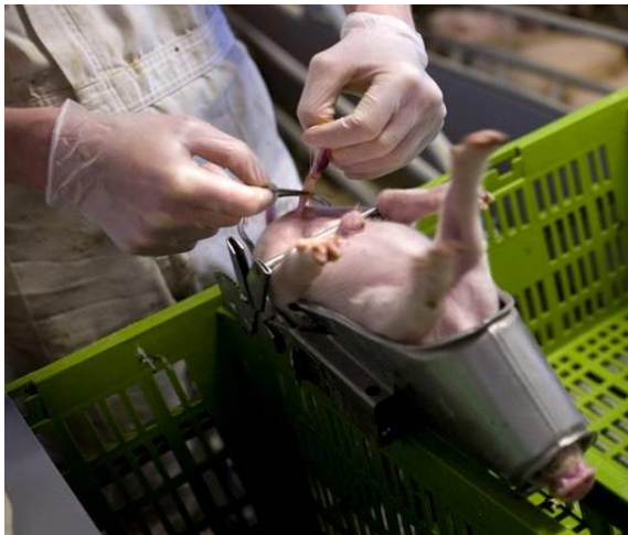
Ophør med kastration