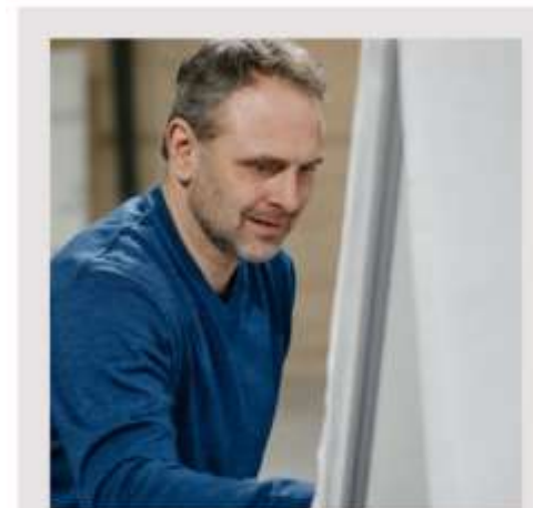
Skatterådgivning. Sammenhængen mellem anlige skattenslys.