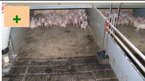
Fast gulv under overdækninger og tætte overdækninger