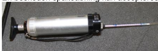
Pumpe og rør til måling af ammoniak