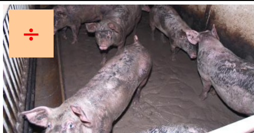
Svineri / søle i stien