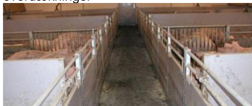
Fast gulv i gangarealer