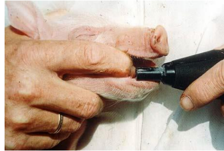
1. Sådan holdes grisen

Pattegrisens hjørnetænder kan slibes indenfor dyrets 4 første levedøgn, hvis der er dokumentation for, at der på bedriften er sket skader på søers pletter eller på andre svins hoveder, herunder ører, som følge af at slibning ikke er foretaget. Slibning af hjørnetænder må kun foretages af en person som er uddannet heri, og som har erfaring (BEK nr. 17, 2016).