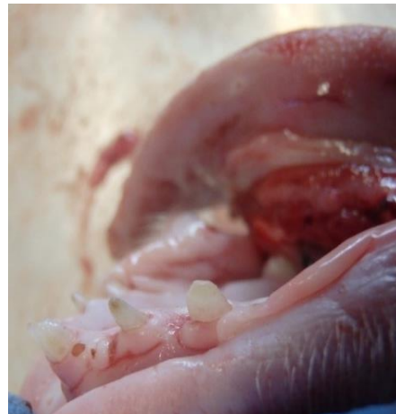
3. Korrekt slebet tænder