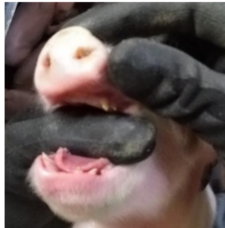
2. Tænder før slibning