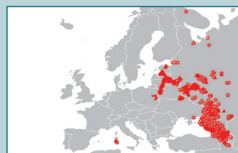
Европейская комиссия и МЭБ. АЧС у диких и домашних свиней, 2007-2016 гг.

Инфекция может передаваться при поедании сырого мяса, мясных субпродуктов или отходов, содержащих вирус, и при перевозке животных. Инкубационный период АЧС (от момента заражения до появления симптомов заболевания) обычно составляет 5-10 дней. Симптомы АЧС почти такие же, как и у классической чумы свиней: высокая температура, понос, покраснение или легкое посинение кожи (цианоз), высокая смертность.