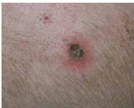
Dyr med skuldarsår.