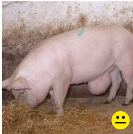
Slagtesvin med navlebrok. Brokket er over 15 cm, uden sår/læsioner og grisens almenbefindende er upåvirket. Bedømmelse: Betinget transportegnet.