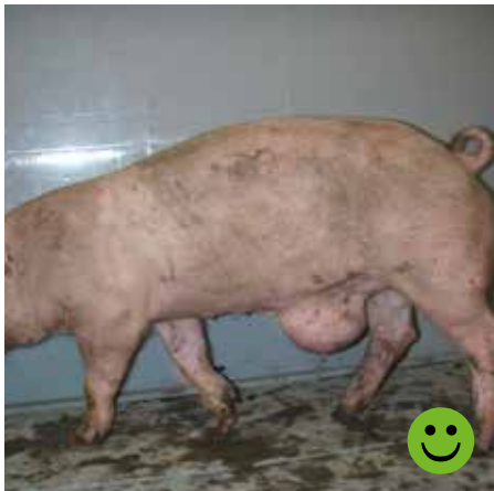
Slagtesvin med navlebrok. Brokket er mindre end 15 cm, uden sår/læsioner og grisens almenbefindende er upåvirket. Bedømmelse: Transportegnet