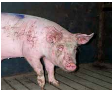
Dyr der har været i slagsmål.