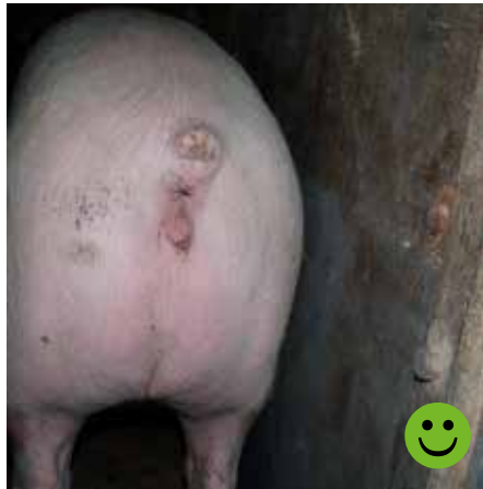
En stor del af hale er borte, såret er tørt og afhelet. Bedømmelse: Transportegnet