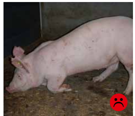
Støttehalt forben Bedømmelse: Ikke transportegnet