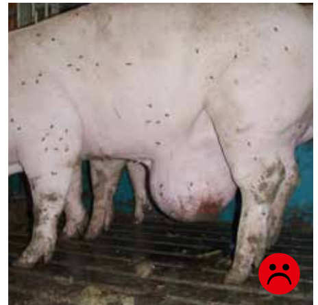
Slagtesvin med navlebrok. Brokket er større end 15 cm og med sår. Bedømmelse: Ikke transportegnet