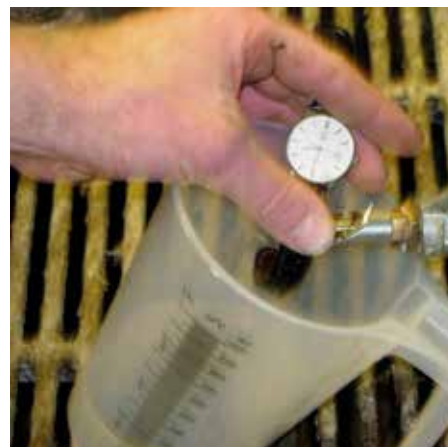
Kontroller vandventilens ydelse ved brug af ur og målebæger.

Ydelse: Smågrise: 0,5-0,8 L/min Slagtesvin: 0,8-1,2 L/min