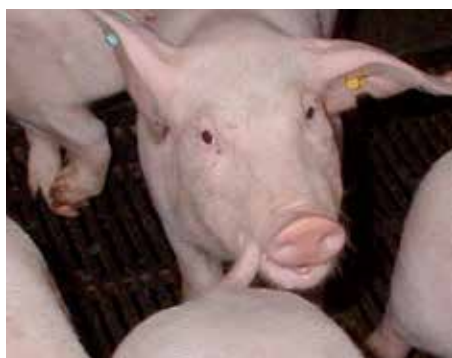
Dyr med halebid, eller dyr der bider.