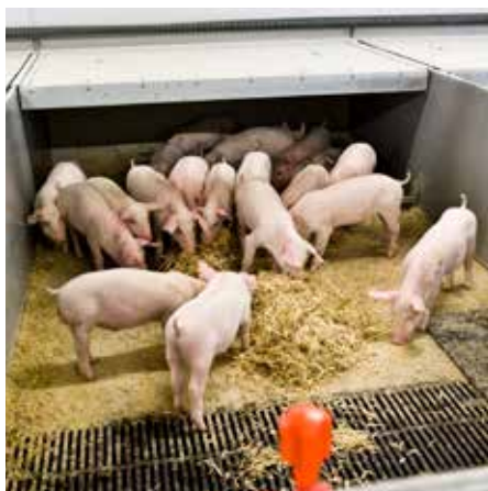
Tildel mere beskæftigelses- og rodemateriale eller suppler med en anden type under et halebidsudbrud.