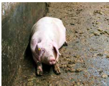
Dyr der sidder eller ligger meget ned.