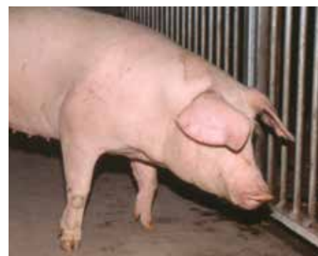
Dyr med ømme og dårlige ben.