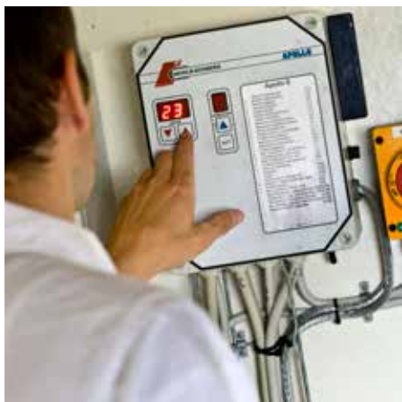
Er temperatur og luftfugtighed i stalden indstillet korrekt? Tjek styringen af ventilationsanlægget. Husk at: Ønsket staldtemperatur + ønsket luftfugtighed \neq 90