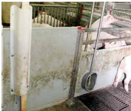
Billede 1: Halm på trådnat er en enkel løsning til tildeling af beskæftigelses- og rodemateriale til f.eks. søer og gylte.