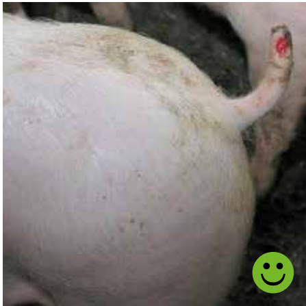
Hale med overfladisk sår, som kun omfatter huden. Bedømmelse: Transportegnet